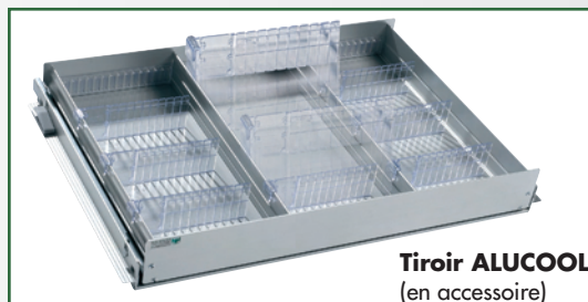
Tiroir ALU-COOL (en accessoire)

Refroidissement ventilé conforme pour l'utilisation en officine. Cuve ABS. Isolation haute densité. Chargement sur grilles. Pas de réglage 32mm.