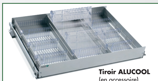
Tiroir ALUCOOL (en accessoire)

Carrosserie traitée époxy blanc - isolation épaisseur 83 mm.