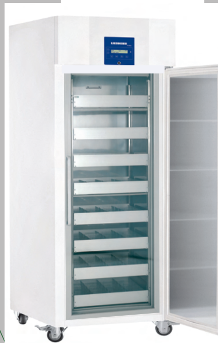
MKPV 6520 (tiroirs en accessoire)