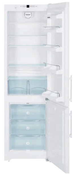
CN 4003 X