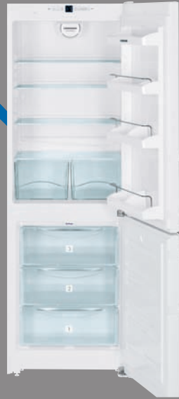
CN 3503 X